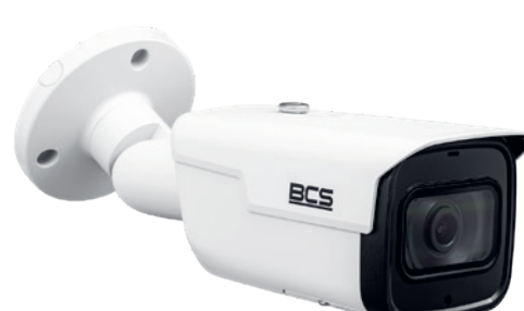
BCS-TIP550 1IR-V-E-AI KAMERA TUBOWA