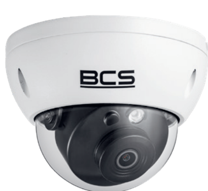
BCS-DMP320 1IR-AI KAMERA KOPUŁOWA