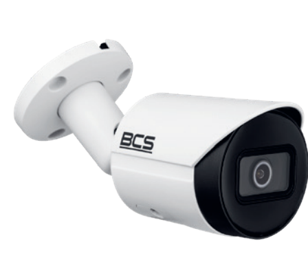
BCS-TIP320 1IR-E-V KAMERA TUBOWA

OFERTA PROMOCYJNA NIE STANOWI OFERTY HANDLOWEJ W ROZUMIENIU KODEKSU CYWILNEGO. PROMOCJA OBOWIĄDUJE OD 2 SIERPNI 2021 DO 31 SIERPNI 2021 LUB DO WYCZERPANIA ZAPASÓW MAGAZYNOWYCH.