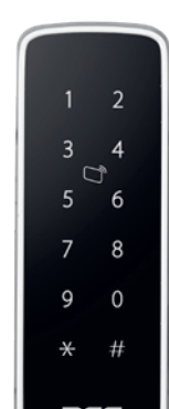
BCS-CKRS-M2Z CZYTNIK RFID