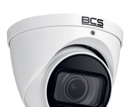
BCS-DMIP220 1IR-V-V KAMERA KOPUŁOWA