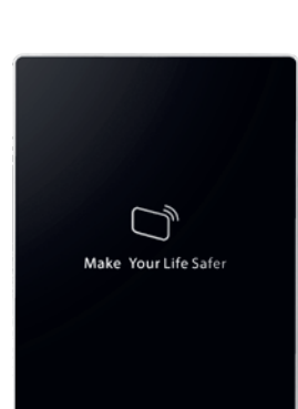
BCS-CRS-M2Z CZYTNIK RFID