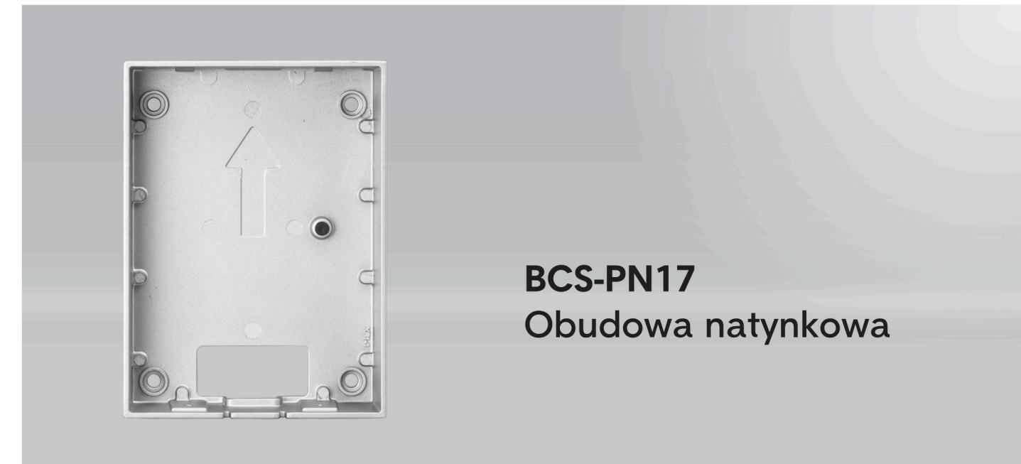
BCS-PN17 Obudowa natynkowa

Do montażu paneli BCS-PAN1611S-S, BCS-PAN9211S-S