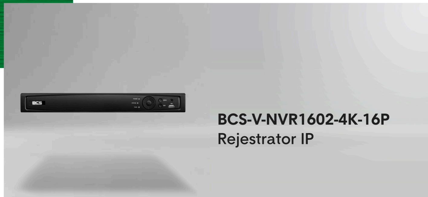
BCS-V-NVR1602-4K-16P Rejestrator IP