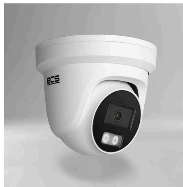
BCS-V-EIP24FSR3-Ai2(2) Kamera IP kopułowa