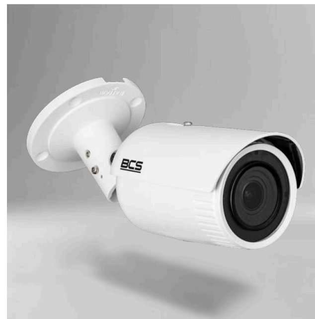
BCS-V-TIP44VSR5(2) Kamera IP tubowa