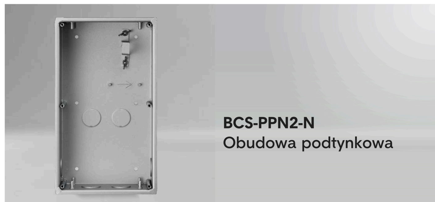
BCS-PPN2-N Obudowa podtynkowa

Z daszkiem, do paneli BCS-PAN1401G-S, BCS-PAN2401G-S, BCS-PAN4401G-S