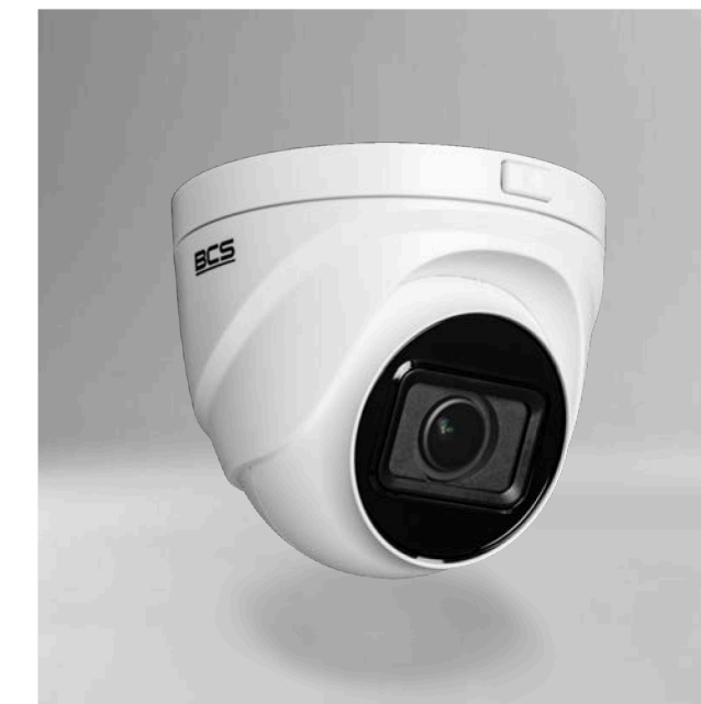
BCS-V-EIP44VSR3(2) Kamera IP kopułowa