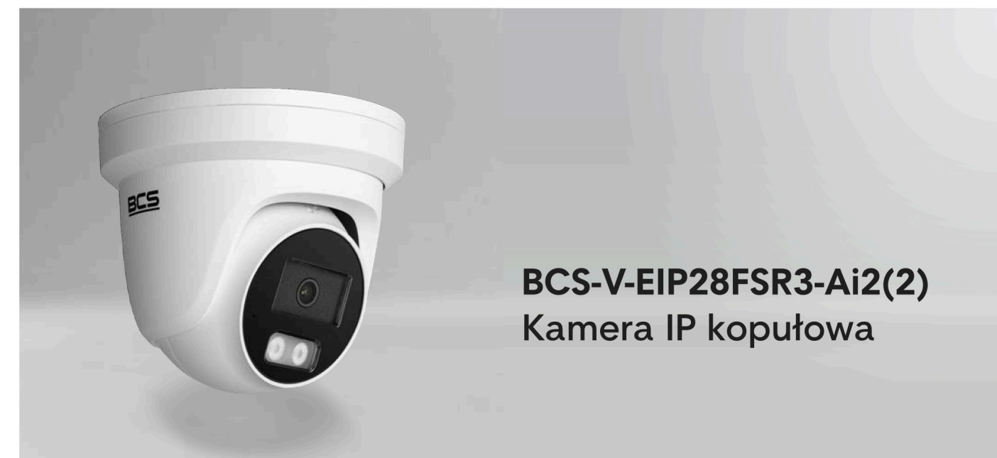
BCS-V-EIP28FSR3-Ai2(2) Kamera IP kopułowa