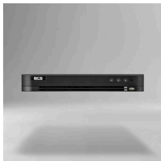
BCS-V-XVR1601-Ai Rejestrator 5-systemowy