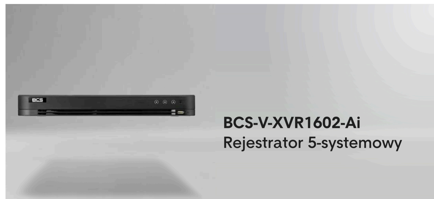
BCS-V-XVR1602-Ai Rejestrator 5-systemowy