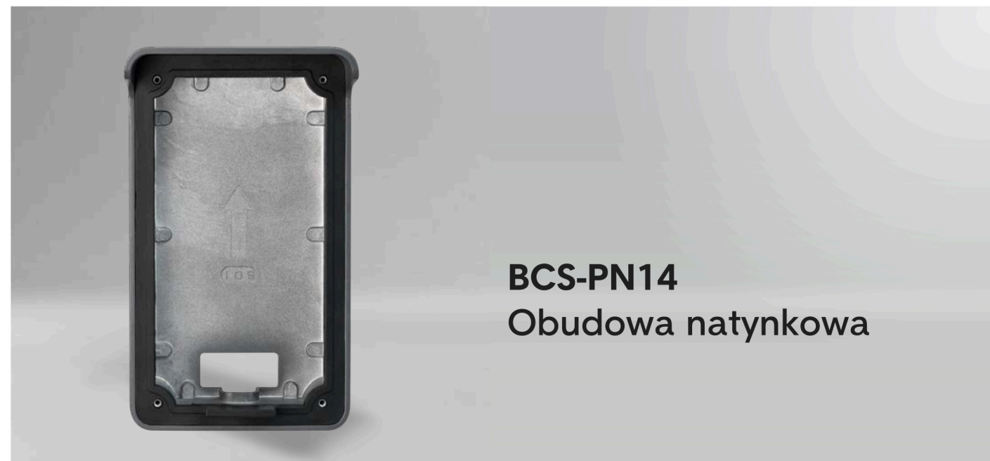
BCS-PN14 Obudowa natynkowa

Z daszkiem, do paneli BCS-PAN1401G-S, BCS-PAN2401G-S, BCS-PAN4401G-S