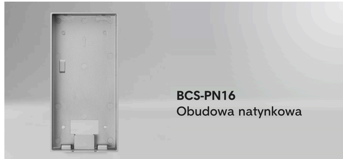
BCS-PN16 Obudowa natynkowa

Do montażu paneli BCS-PAN1611S-S, BCS-PAN9211S-S