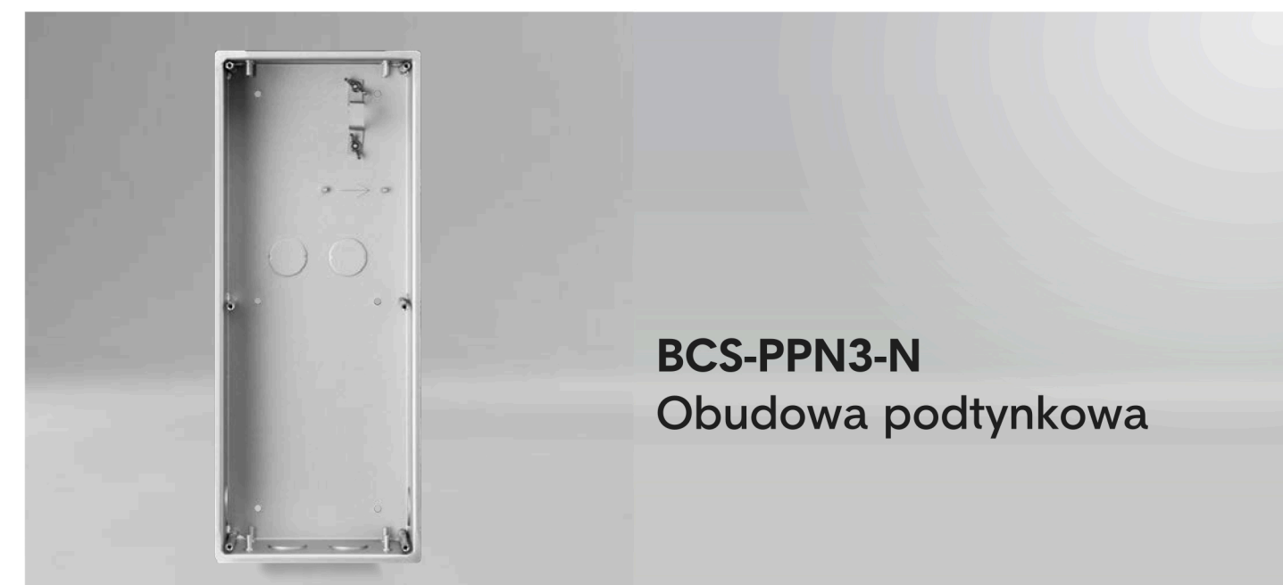
BCS-PPN3-N Obudowa podtynkowa

Promocja ważna od 4 do 29 maja 2026r. lub do wyczerpania zapasów magazynowych.