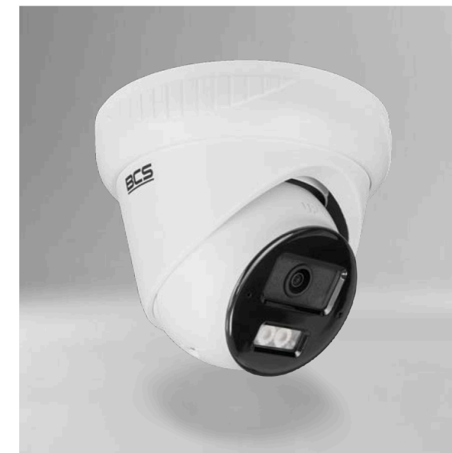
BCS-V-EIP24FSR3L3-AI1(2) Kamera IP kopułowa