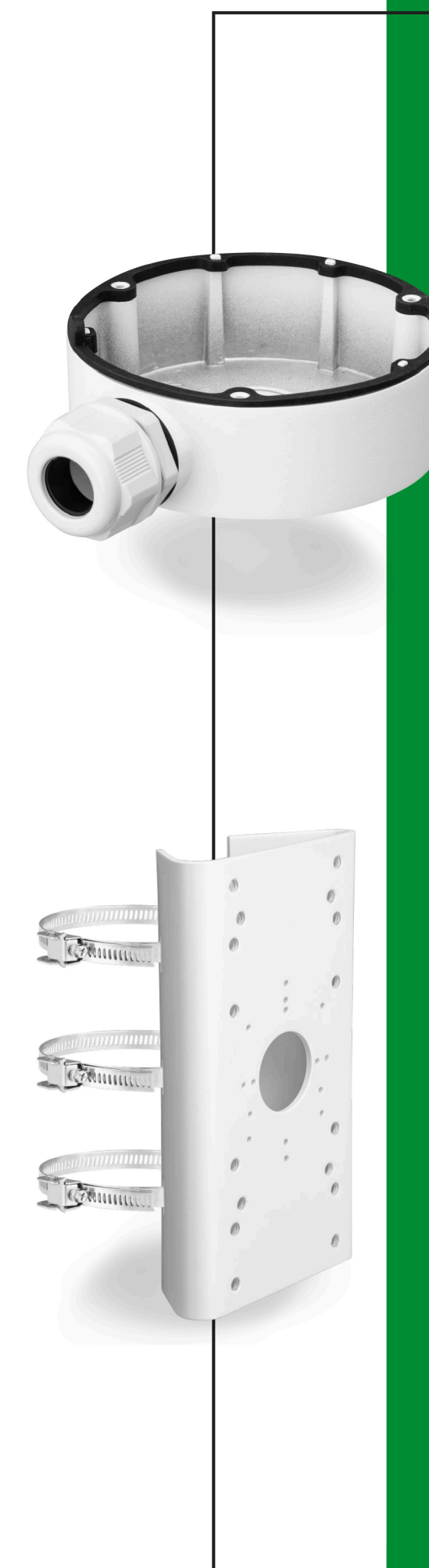
BCS-V-AMD Puszka montażowa Do kamer serii BCS VIEW