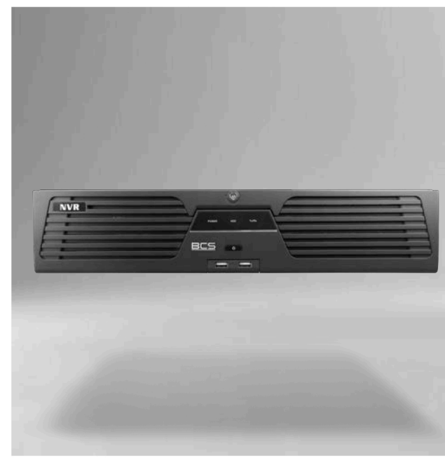
BCS-V-NVR6408R-A-8K Rejestrator IP