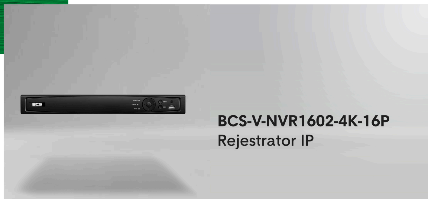
BCS-V-NVR1602-4K-16P Rejestrator IP