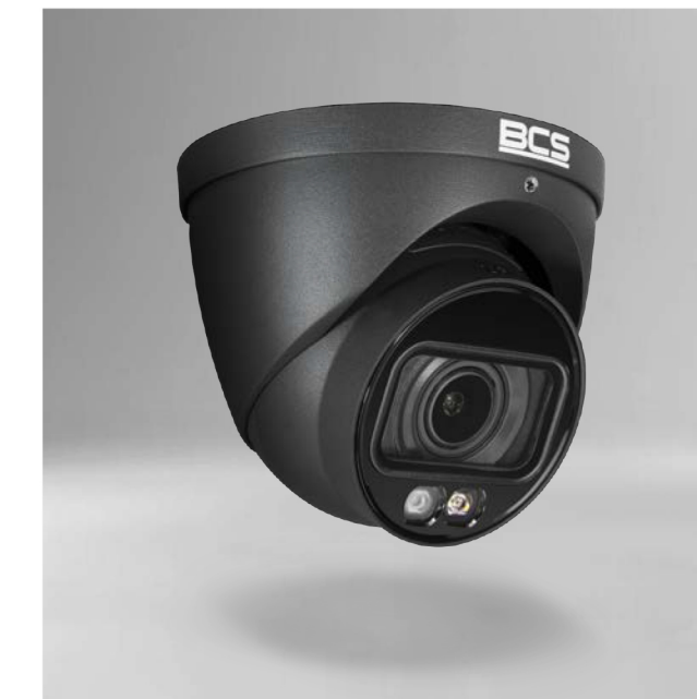
BCS-L-EIP56VCR5L4-Ai1-G Kamera IP kopułowa