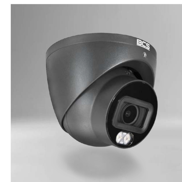
BCS-L-EIP14FCL3-Ai1-G Kamera IP kopułowa