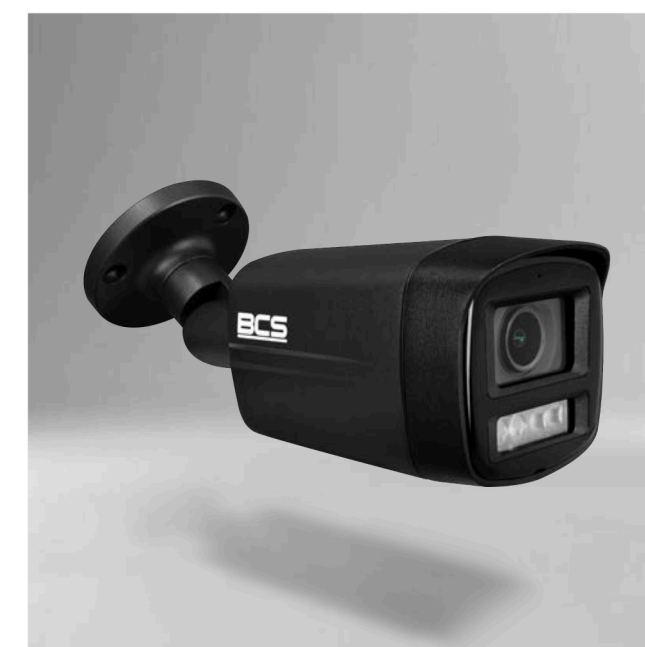
BCS-L-TIP14FCL5-Ai1-G Kamera IP tubowa