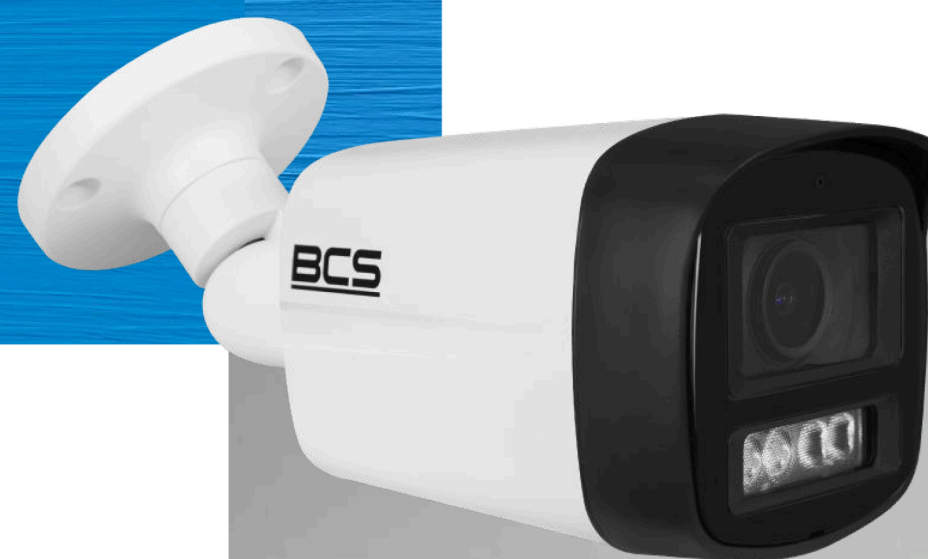
BCS-L-TIP14FCL5-Ai1 Kamera IP tubowa