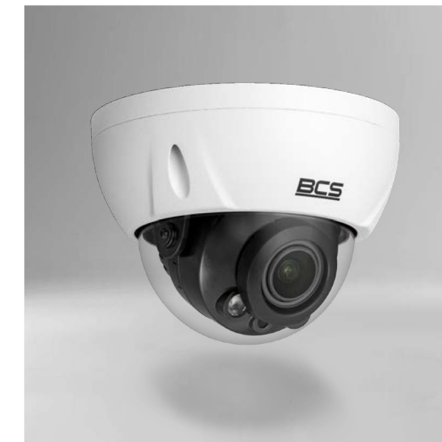
BCS-L-DIP45VSR4-Ai1(2) Kamera IP kopułowa