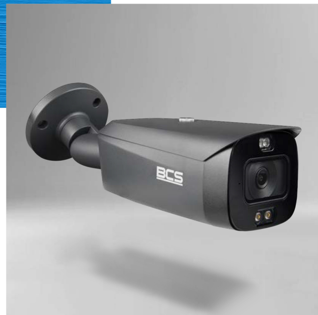
BCS-L-TIP55FCR3L3-Ai1-G(3) Kamera IP tubowa