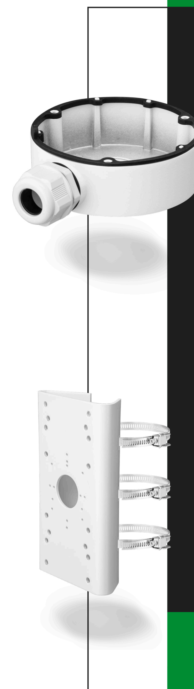
BCS-V-AMD Puszka montażowa Do kamer serii BCS VIEW