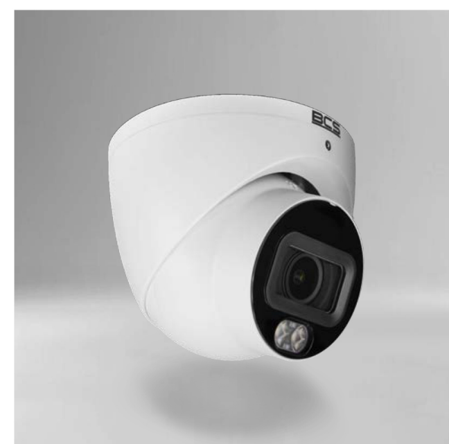
BCS-L-EIP14FCL3-Ai1 Kamera IP kopułowa