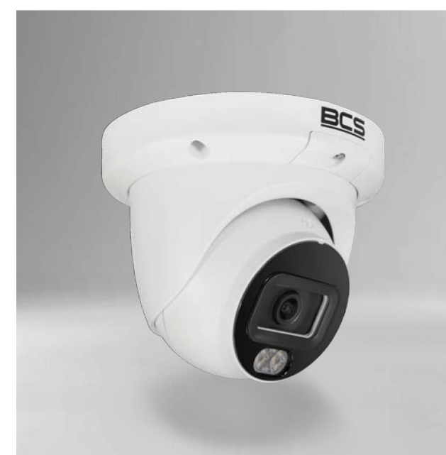
BCS-L-EIP26FCR3L3-Ai1 Kamera IP kopułowa