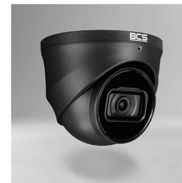
BCS-L-EIP25FSR5-Ai2-G Kamera IP kopułowa