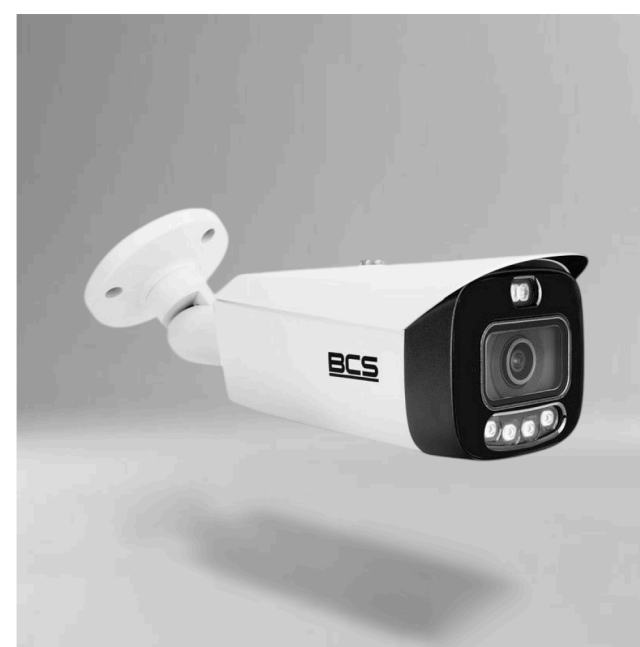
BCS-L-TIP68FCR5L5-Ai1 Kamera IP tubowa