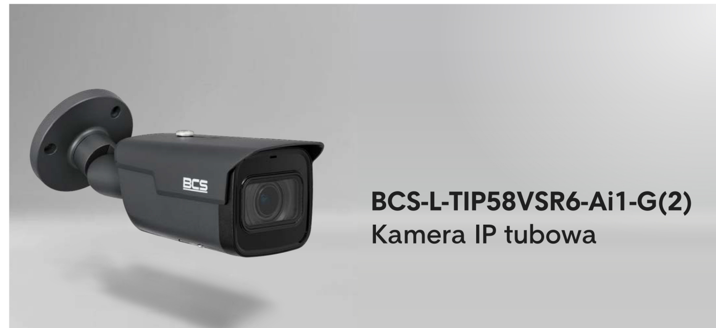
BCS-L-TIP58VSR6-Ai1-G(2) Kamera IP tubowa