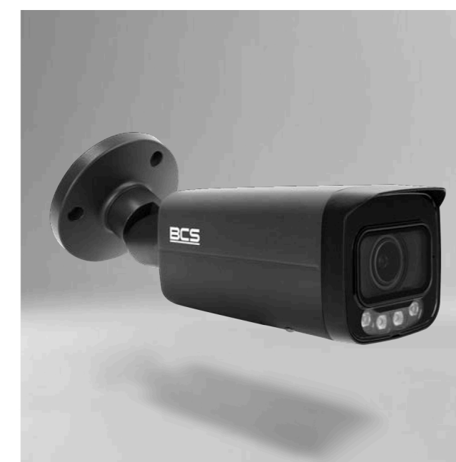
BCS-L-TIP56VCR6L6-Ai1-G Kamera IP tubowa