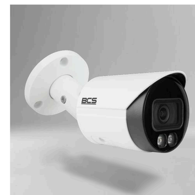
BCS-L-TIP18FCR3L3-Ai1 Kamera IP tubowa