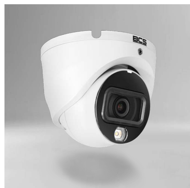
BCS-L-EIP18FCR3L3 Kamera IP kopułowa